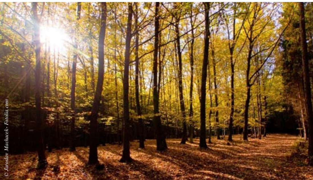
La Société Forestière a décidé en 2006 d'infléchir son dispositif de sylviculture en intégrant le changement climatique