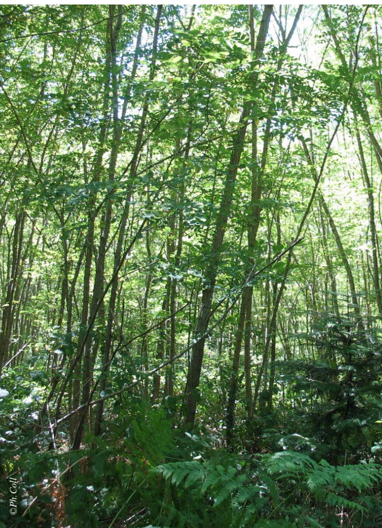
Au bout de quinze ou vingt ans, les robiniers ont déjà cette allure. À ce stade, les débouchés des bois d'éclaircies sont surtout locaux.

Entre Le Mans et Angers, dans la forêt de Caillebert, gérée par la Société Forestière, les arbres ont souvent très soif l'été, alors qu'ils ont les pieds dans l'eau l'hiver. Une situation que les climatologues annoncent comme fréquente dans le reste du pays d'ici à quelques années. Cette forêt est donc devenue « un laboratoire de l'adaptation aux effets du changement climatique ».