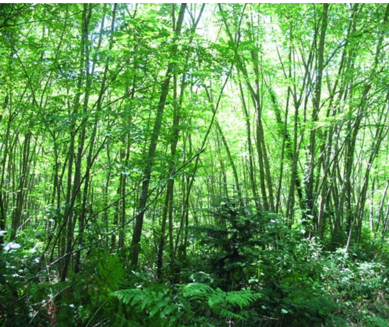
Elargir la liste des essences de transition (ici, des robiniers) et tenir compte de la capacité des sols à absorber et retenir l'eau.

Pionnière, la Société Forestière a choisi d'intégrer le changement climatique dans la gestion des forêts de ses clients. Le 3 mars 2009, elle a présenté ses nouvelles orientations pour 2009-2011. Nourries par les apports de la communauté scientifique, ses observations de terrain et l'échange d'expériences qu'elle a suscité entre acteurs de la forêt - notamment par la proposition du premier blog français forêts et climat - cette nouvelle génération d'orientations de gestion vient autant renforcer qu'affiner les options prises.