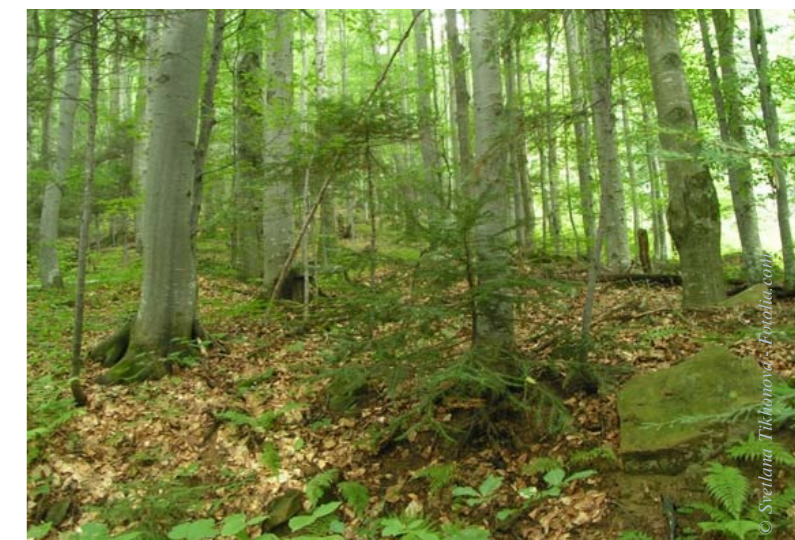
Augmentation du taux de CO 2 et améliorations de la qualité des plants permettent de raccourcir les révolutions des peuplements et autorisent une récolte plus rapide.

Sécheresse et canicule estivale ont été retenues comme un des impacts décisifs sur les forêts du changement climatique annoncé. Par les variations du régime des pluies, le changement climatique soulève de nombreuses questions concernant la ressource en eau. C'est pourquoi la Société Forestière examine en priorité la capacité des sols à restituer l'eau aux peuplements, selon les saisons, et privilégie ce critère appelé « réserve utile » en eau des sols. Afin d'économiser l'eau disponible, elle renforce sa connaissance des stations forestières et adapte la densité des arbres des peuplements qu'elle gère (directement liée à la consommation en eau), à tous les stades de croissance. 🌱