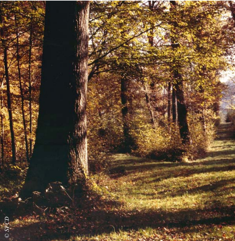
Le chêne sessile a mieux résisté à la sécheresse en 2003 que le chêne pédonculé.

Un des choix de la Société Forestière est de recourir à des essences et variétés dites « de transition » : des arbres capables de s'épanouir à la fois dans le climat actuel et dans le climat annoncé pour le futur.