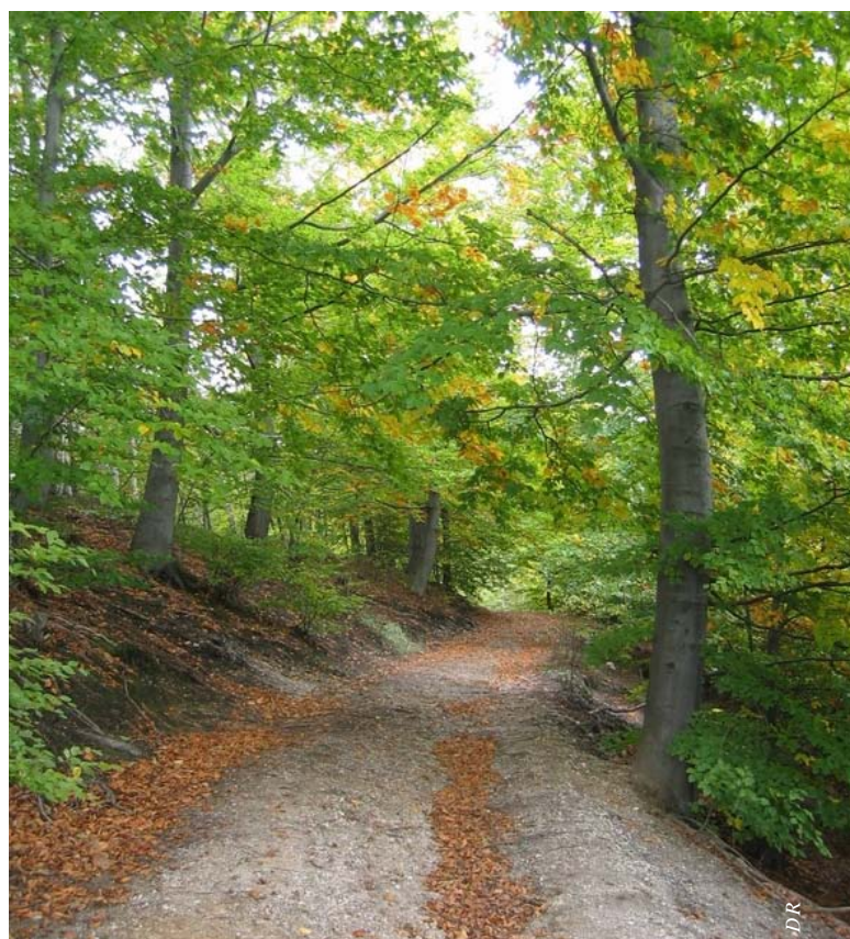
La réserve utile mesure la capacité d'un sol à restituer en période de sécheresse l'eau stockée pendant le reste de l'année .

Les résultats sont donc à prendre comme un indicateur, plus que comme une analyse fine et tranchée. Le gestionnaire doit faire son choix final, en fonction de son expérience aussi, mais en intégrant désormais ce critère, ou cet indicateur, dans sa réflexion. 🌳