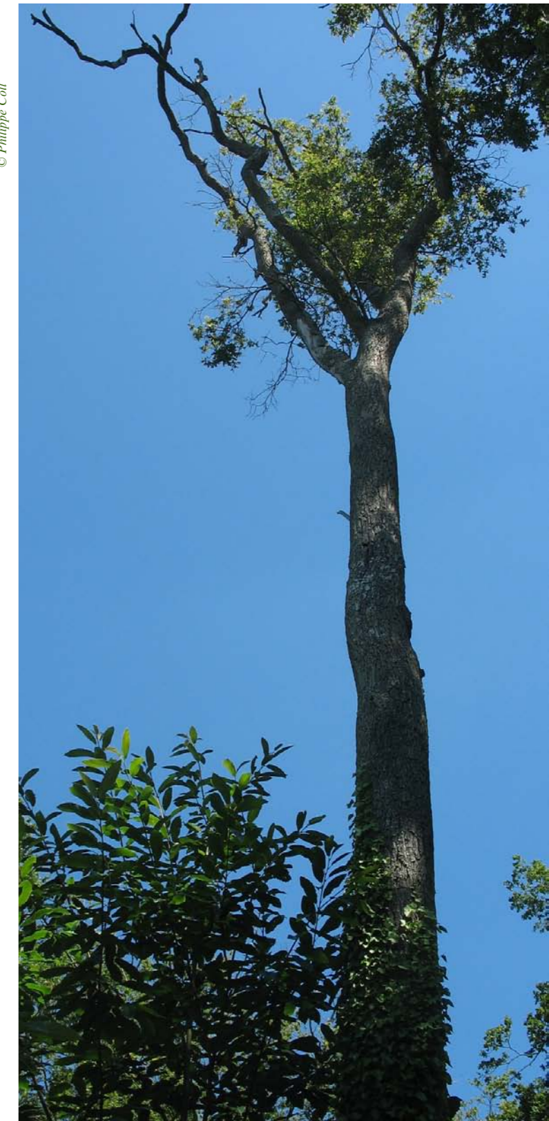
La Société Forestière se donne les moyens d'établir une cartographie originale des risques (ici chêne mourant), avec celle des solutions possibles : de la modification des peuplements à la sylviculture pratiquée.

L'identification des essences et variétés dites de « transition », ensuite. Le répertoire de feuillus et résineux susceptibles de s'épanouir à la fois dans le climat actuel et dans le climat futur s'élargit. Les différentes utilisations possibles sont précisées (voir aussi article sur les essences de transition).